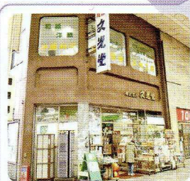
文光堂 × 平田 龍斗