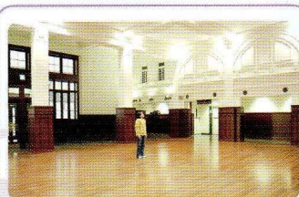
オリナス一宮 × Edokoro