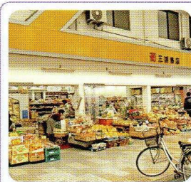
三浦商店 × 沢崎 良太