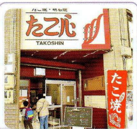
たこ心 × 山田 源