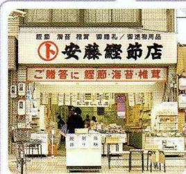
安藤経節店 × 藤岡 洸