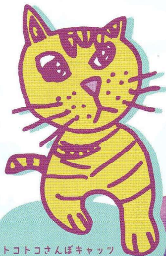
トコトコさんぽキャッツ Illustration by YOSHIDA Sora

実際に商店街を歩きながらモチーフとなったお店を 訪れたり、お店の人と触れ合ってみてください。